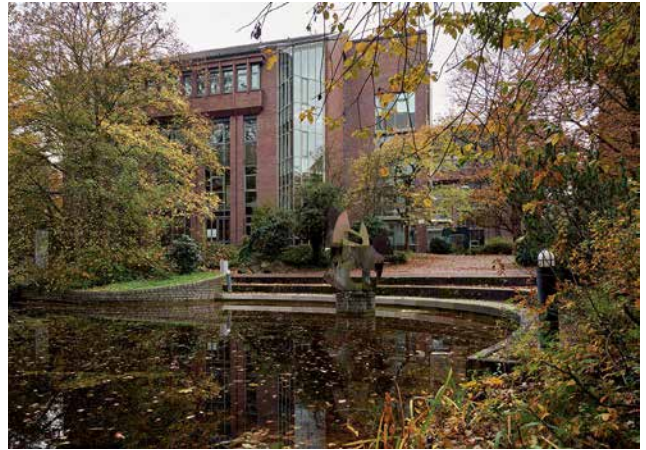
Technische Universität Hamburg-Harburg

gerade durch den allgemeinen Entwicklungsdruck stärker gefährdet als andere Bauschichten“, beobachtet Sassen-scheidt. Das liege zum einen an der noch mangelnden gesellschaftlichen Wertschätzung für die verhältnismäßig jungen Gebäude. Zum anderen erreichen viele Bauten der Postmoderne gerade ihre erste Sanierungsphase, in der sie überformt oder sogar abgerissen werden könnten. Selbst wenn es nicht gleich zum Abriss kommt, jede Sanierungsmaßnahme birgt das Risiko, dass entscheidende Details eines Denkmals in spe verschwinden, etwa