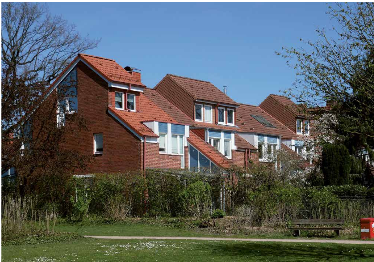
Wolfgang-Borchert-Siedlung in Hamburg-Alsterdorf

borg und Friedrich Spengelin ist etwa das qualitätsvolle Gebäude der Erich-Kästner-Schule in Farmsen von den Architekten Gorges, Gorges-Imhof, Rosenbusch unwiederbringlich verloren“, ärgert sich Sassenscheidt. Während der Schulkomplex anfangs noch komplett saniert werden sollte, erfolgte letztendlich doch der Abbruch des alten Hauptgebäudes und ein Neubau im Jahr 2020. „Die Stahlbetonskelettkonstruktion hätte grundsätzlich weitgehende Anpassungen an neue Nutzungen ermöglicht“, moniert Sassenscheidt. Und obendrein hätte eine Sanierung statt dem Abriss reichlich CO 2 eingespart, was in Zeiten des Klimawandels ebenfalls ein entscheidendes Argument sein sollte. „Umso mehr ist zu begrüßen, dass das Denkmalschutzamt die Epoche inzwischen intensiv erforscht und die wichtigsten Objekte unter Schutz gestellt hat“, so Sassenscheidt.