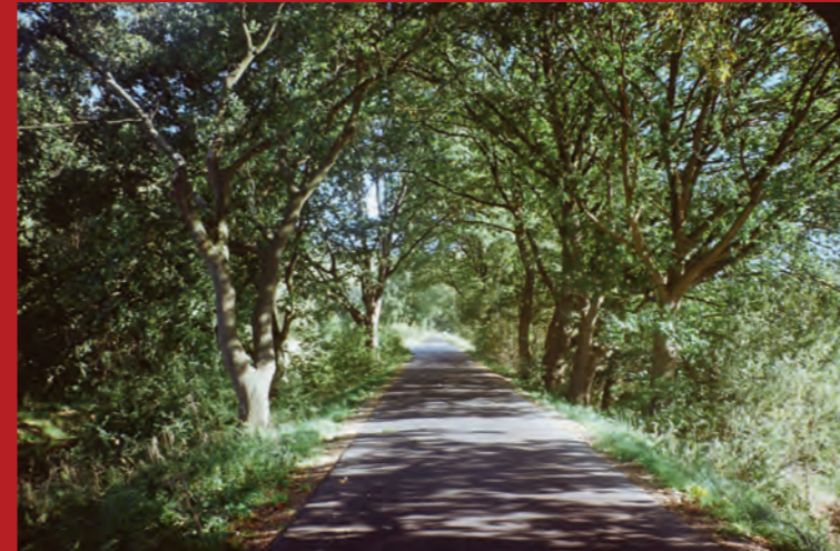
Der Marschbahndamm im Stadtteil Kirchwerder