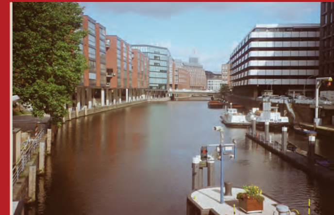
Fisch aus Finkenwerder und Gemüse aus den Vierlanden gelangten früher auf dem Wasserweg nach Hamburg. Am Schaartor, einem von damals zehn Stadttoren, die man erst 1616 auf sechs reduzierte, wurde kontrolliert. Heute markiert eine Schleuse, die 1967 zum Hochwasserschutz neu errichtet worden war, den historischen Ort.