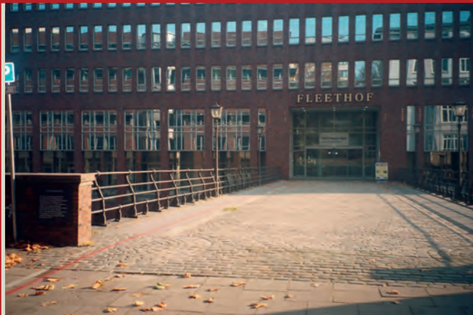
Das Ellerntor am Herrengabenfleet verband Altstadt und Neustadt im 17. Jahrhundert miteinander. Später führte sogar eine Straßenbahn über das Fleet. Die Ellerntorsbrücke endet heute als Sackgasse in einem Bürohaus, das Tor wurde bereits 1668 abgerissen.